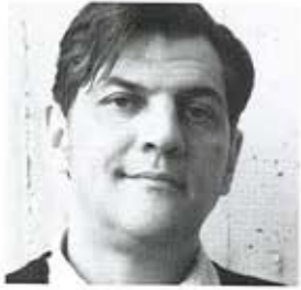
cuypers & Q architecten, Gert Cuypers, Antwerpen