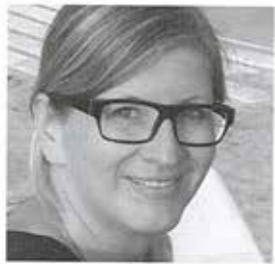
cuypers & Q architecten, Ilze Quaeys, Antwerpen

"Glanzend helder wit met een gouden randje voor een optimaal kustgevoel"