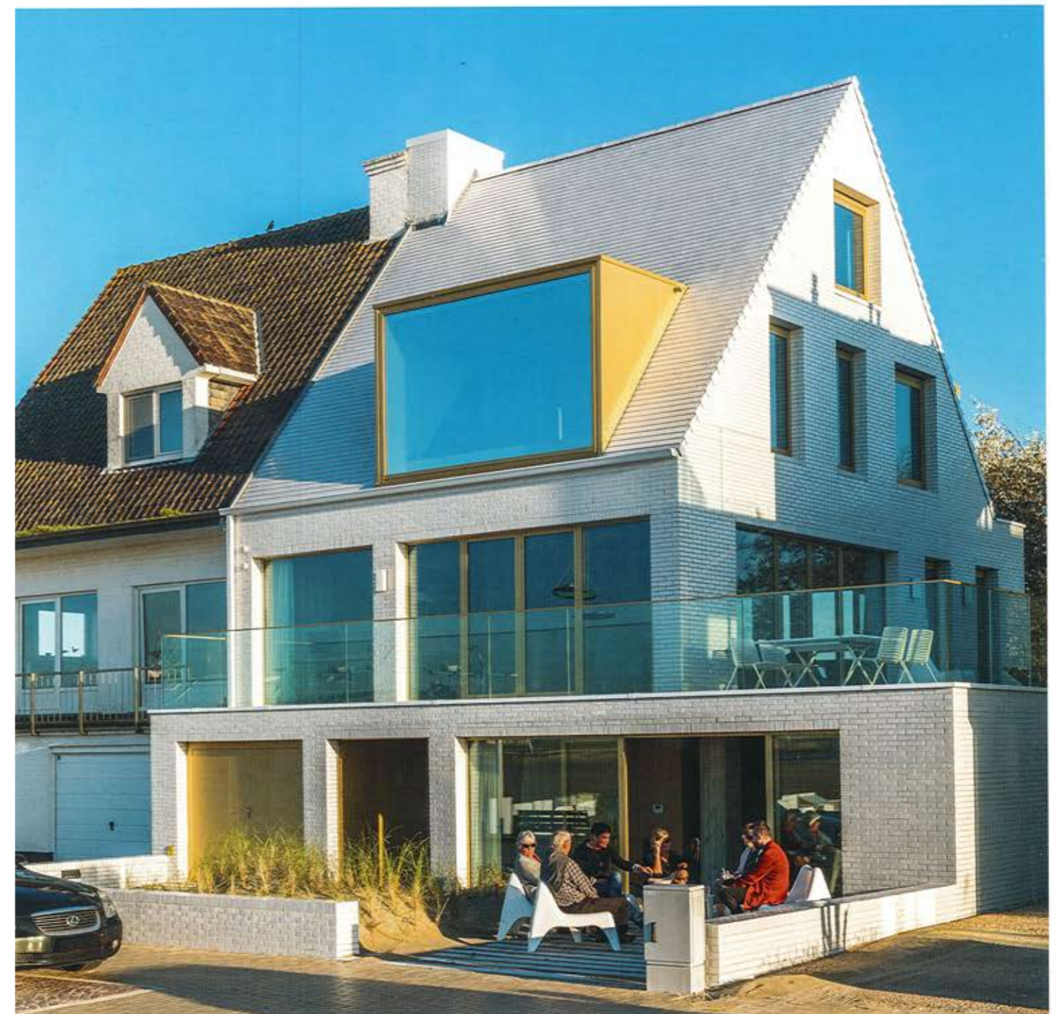
Terca Wit Geglazuurd en Koramic Tegelpan 301 Wit geglazuurd