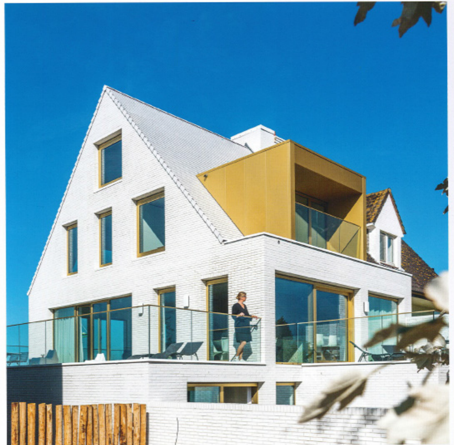
Project Zeebrugge, zie p. 92